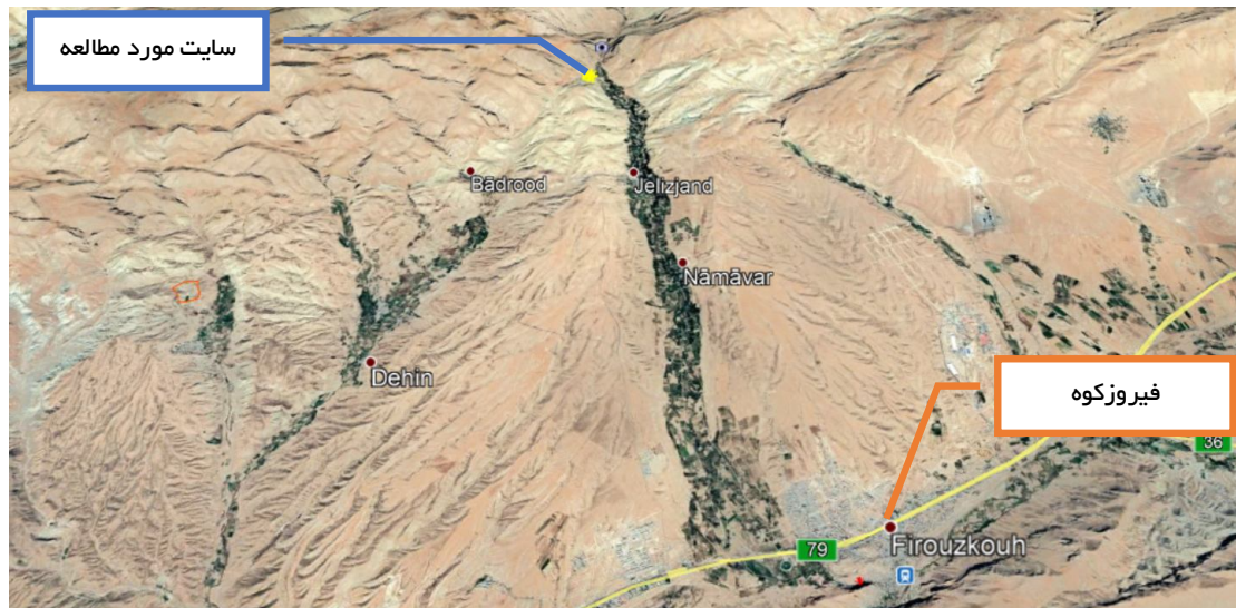
تصویر شماره (۳) : موقعیت محدوده مطالعه نسبت به روستای جلیزجند